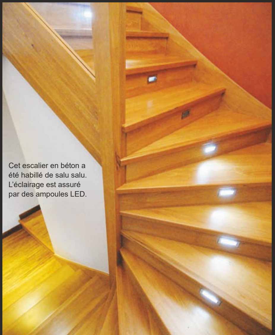
Cet escalier en béton a été habillé de salu salu. L'éclairage est assuré par des ampoules LED.