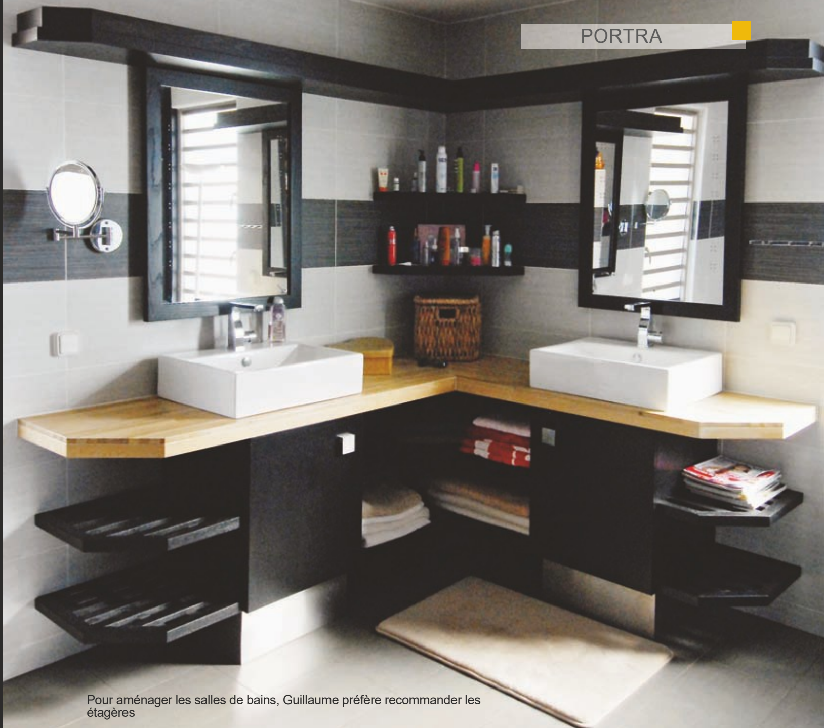
Pour aménager les salles de bains, Guillaume préfère recommander les étagères

Guillaume a réalisé pour cette maison des dressings sur mesure en utilisant des panneaux de mélaminé en alu brossé et en chêne massif teinté noir. L'agencement en étagères, tiroirs et penderies est organisé sur mesure. Sinon, du simple placard au dressing "pièce", il n'y a pas de limites pour ce menuisier.